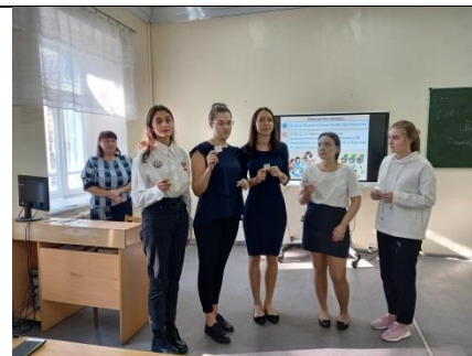
Жеребьевка участников внутриколледжного чемпионата WSR по компетенции «Дошкольное воспитание»

Сертификатами были награждены эксперты внутриколледжного чемпионата.