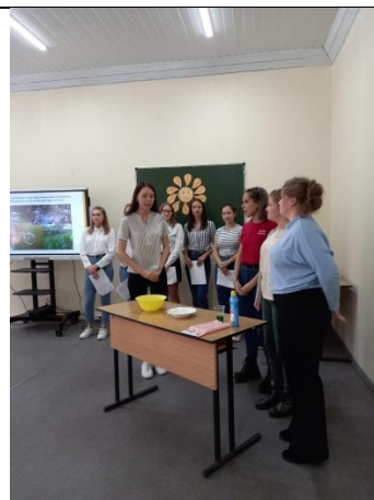
Организация исследовательской деятельности с детьми (волонтерами) в летний период