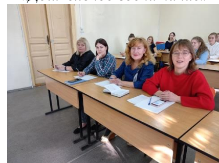
Эксперты внутриколледжного чемпионата WSR по компетенции «Дошкольное воспитание»