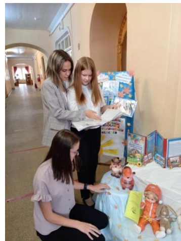
Праздничная композиция «День воспитателя и всех дошкольных работников»