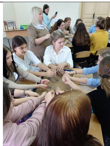
Обучающиеся 313 группы знакомятся с материалом для проведения игр с песком