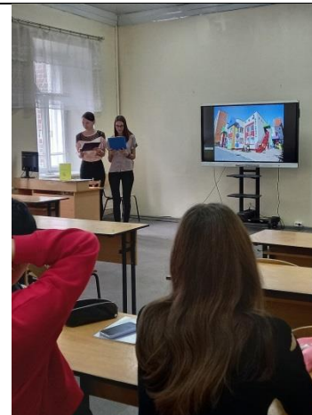
Открытие методической недели специальности 44.02.01. Дошкольное образование