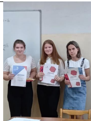
Заккрытие методической недели специальности 44.02.01. Дошкольное образование